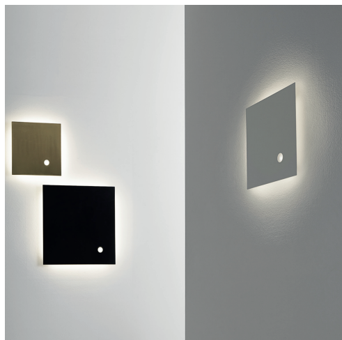
piana 40/ap stone*